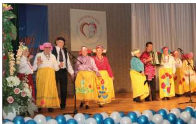
4-й Харьковский городской фестиваль клубов активного долголетия «С весной в сердце!»