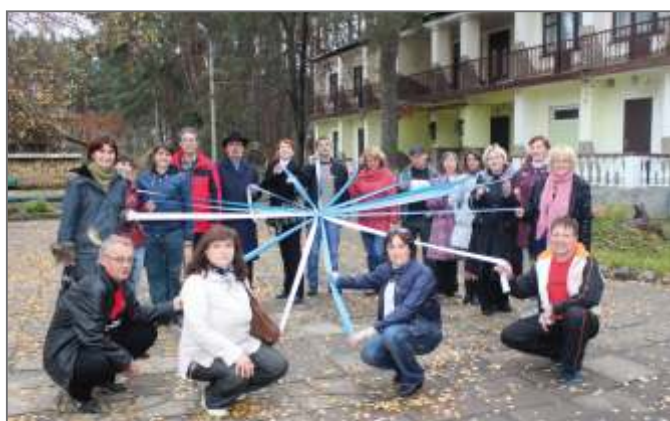
Учебно-рекреационный лагерь «Лидер»