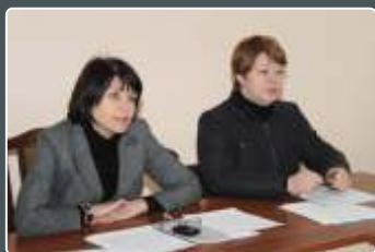
09.02.2012 г. Малый зал Администрации Дзержинского района. Семинар на тему «Защита права на доступность»