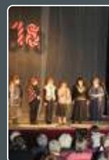
25.04.2012 г. Молодежный парк. Международная акция «Зажги свечу», посвященная памяти героев-ликвидаторов последствий аварии на Чернобыльской АЭС