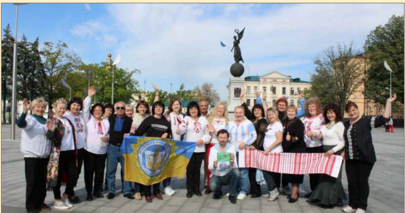
20 травня 2017 р. Початок проекту «Слобожанщина та Поділля – разом: Кращі практики в соціальній політиці». Від'їзд з м. Харкова