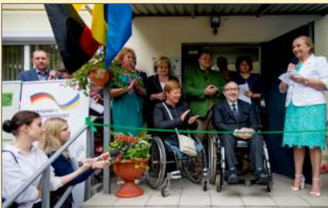
23 серпня 2017 р. Відкриття соціального центру «Сім'я»