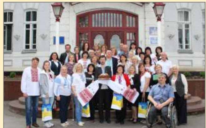
22 травня 2017 р. Зустріч учасників проекту в мерії м. Хмельницький