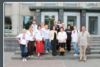
24.05.2017 г. Посещение общественной организации «Гармония» города Винница.