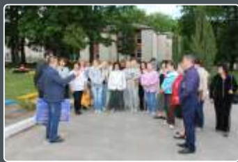
24.05.2017 г. Посещение оздоровительного комплекса «Чайка» города Хмельницкий.